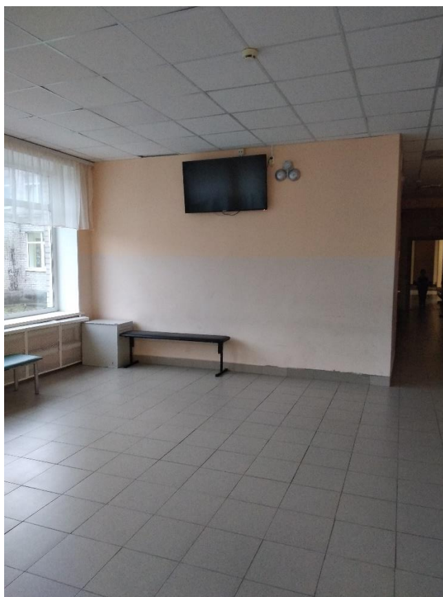
Рис. 8. Во всех рекреациях и фойе установлены телевизоры для трансляции информации, в том числе для лиц ОВЗ.