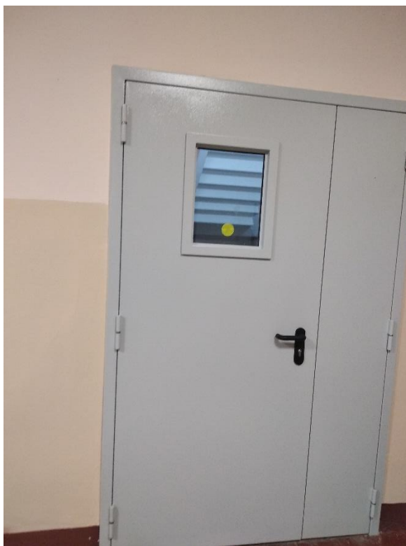
Рис. 7. Лестничные марши оборудованы противопожарными металлическими дверями с окном и доводчиком. Для лиц ОВЗ в окнах размещены желтые сигнальные круги. Замена дверей произведена в 2018г.