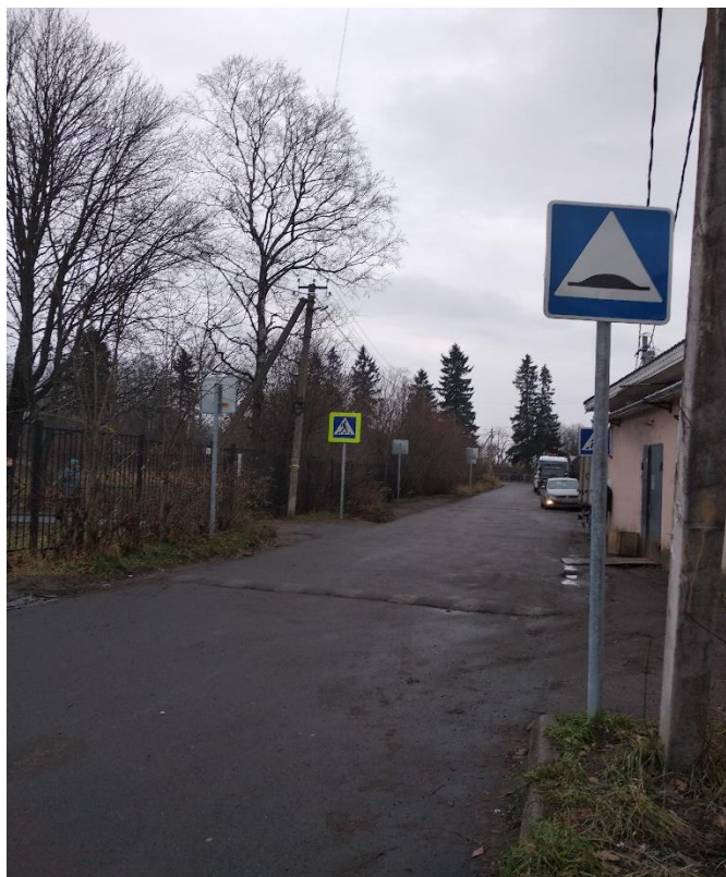
Рис. 1. Дорожные знаки и разметка на пути к школьной калитке. Асфальтирование дороги произведено в августе 2019г.