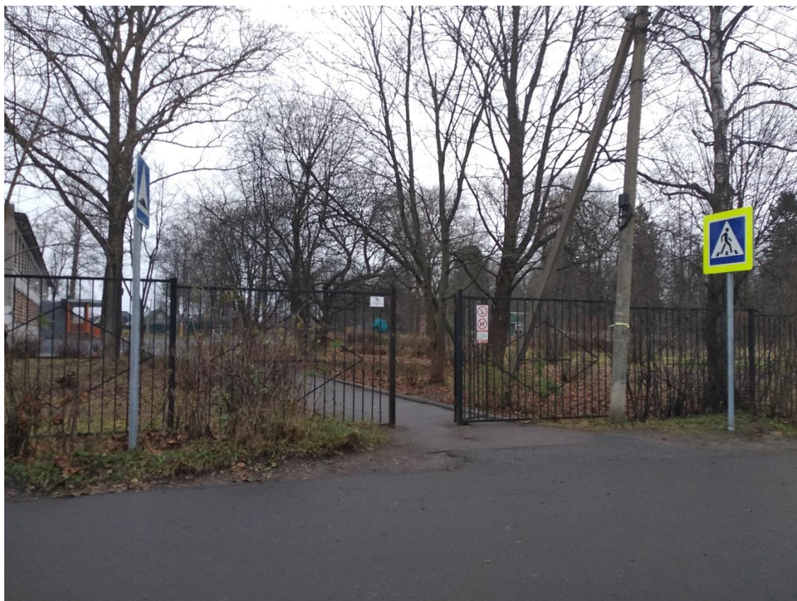
Рис. 2. Вход в калитку со стороны дороги.