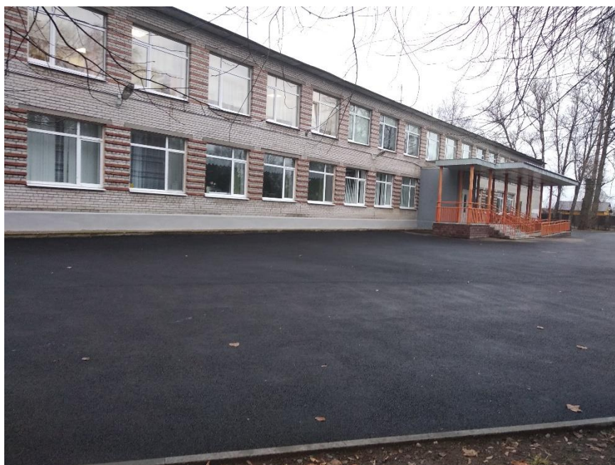
Рис. 4. Беспрепятственный подход с входу в здание.