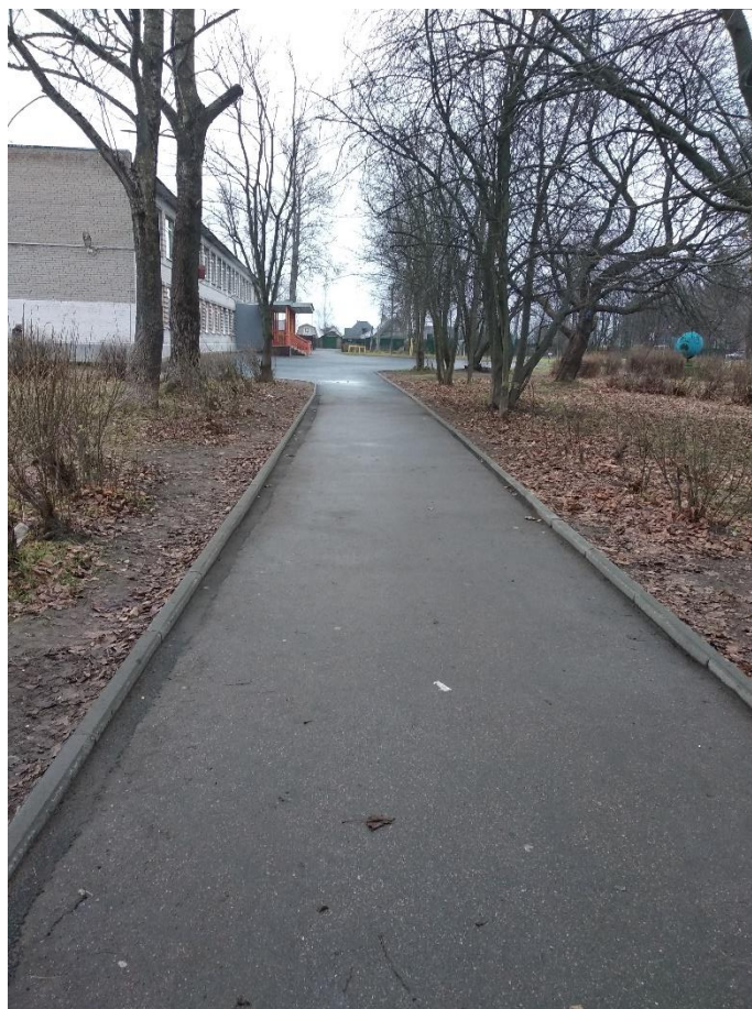
Рис. 3. Асфальтирование пришкольной территории выполнено в августе 2019г.