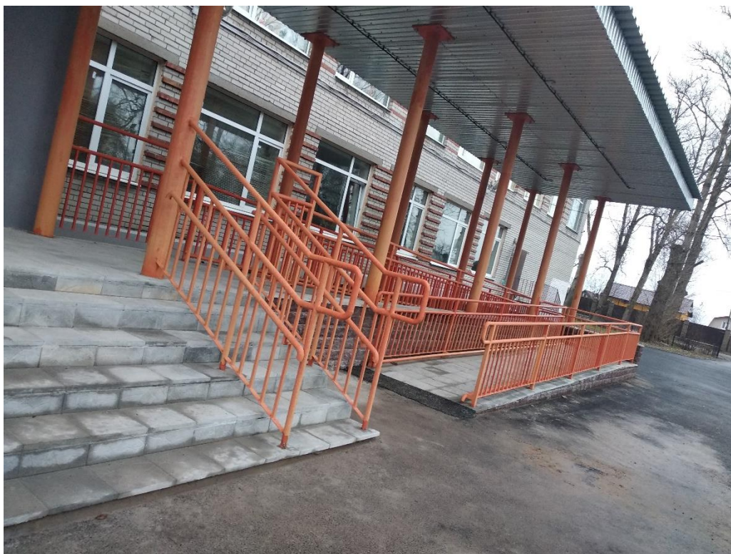
Рис. 5. Главный вход в здание оборудован стационарным пандусом с поручнями и навесом. Реконструкция произведена в 2019г.