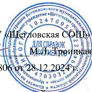
ГРАФИК ПИТАНИЯ В ШКОЛЬНОЙ СТОЛОВОЙ МОУ «Щегловская СОШ» Вторник - пятница