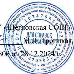
ГРАФИК ПИТАНИЯ В ШКОЛЬНОЙ СТОЛОВОЙ МОУ «Щегловская СОШ» Понедельник