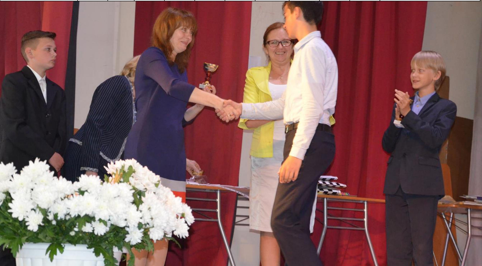
Праздник по итогам года «Звёздная дорожка»