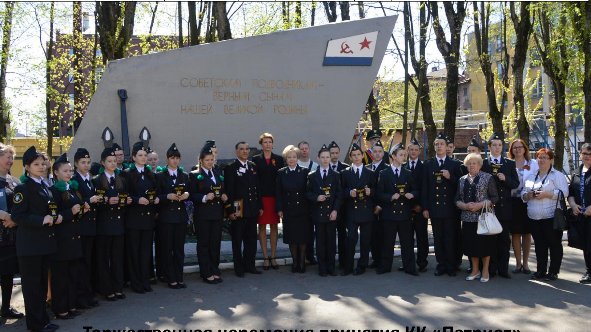
Торжественная церемония принятия КК «Патриот» под патронат УФССП России по Ленинградской области