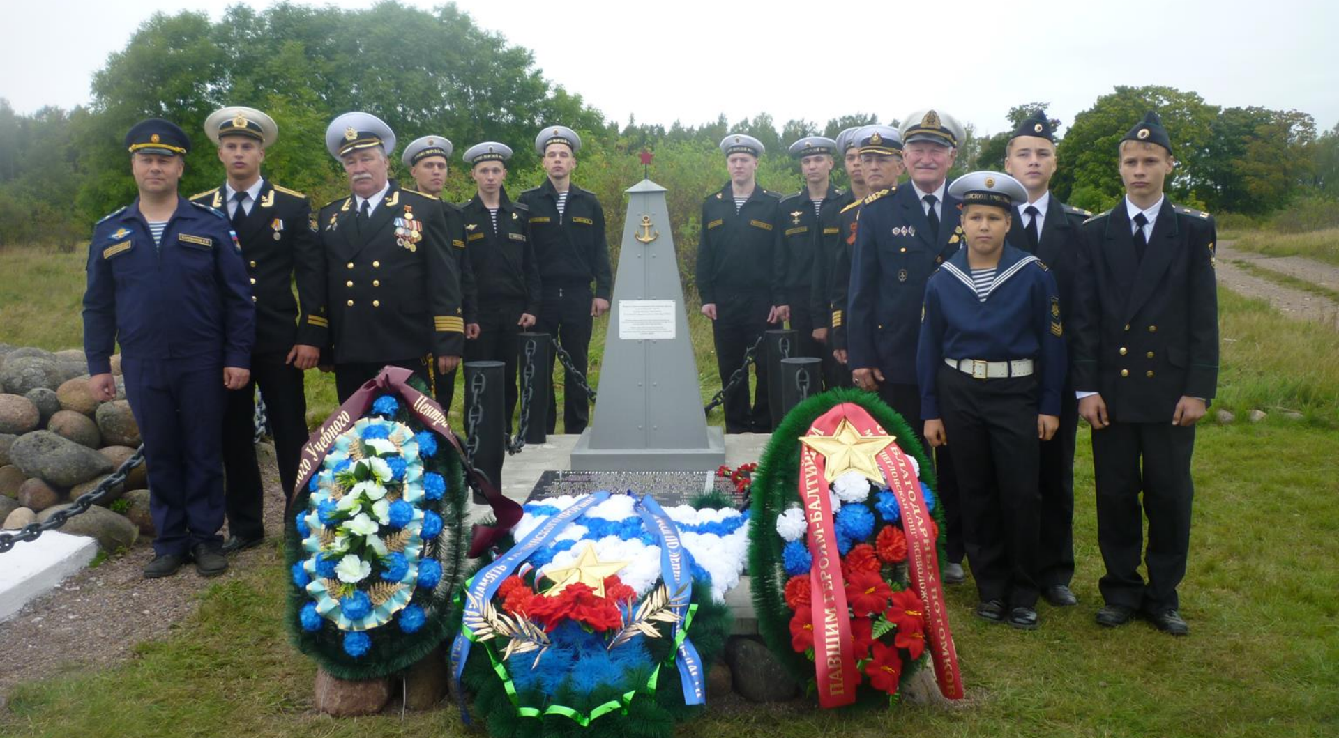
Памятная церемония, посвящённая 75-летию «Таллинского прорыва». 36 Остров Гогланд