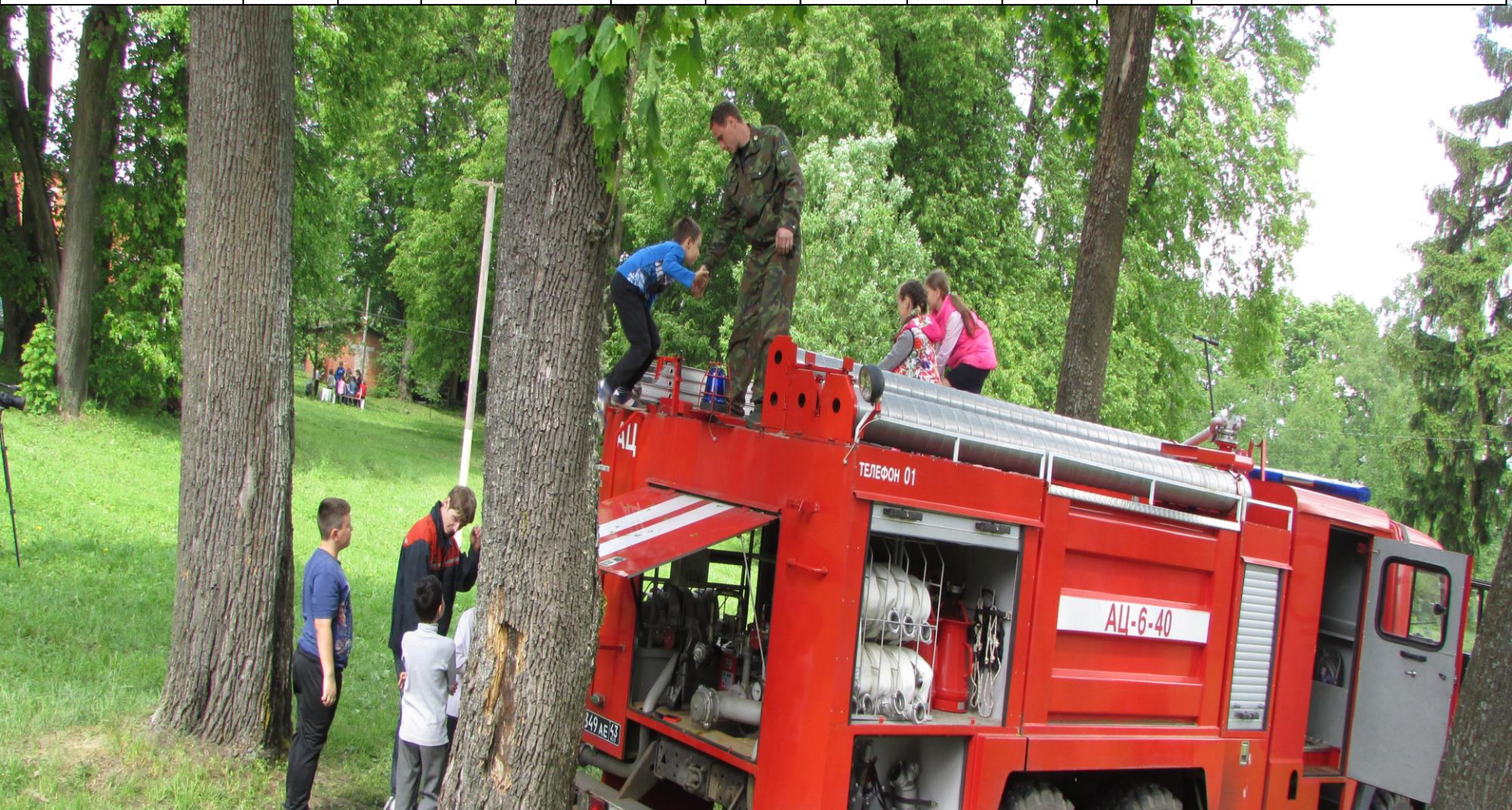
Демонстрация работы пожарной машины ГУ "Оборонлес" Минобороны России на Лесном Фестивале