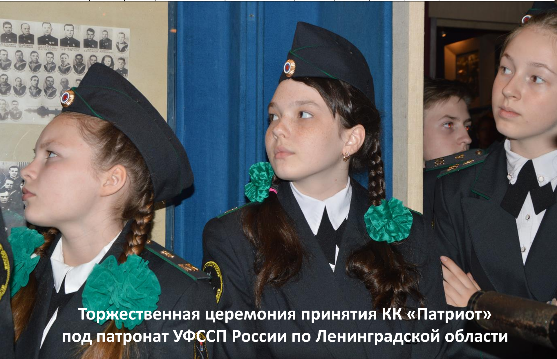
Торжественная церемония принятия КК «Патриот» под патронат УФССП России по Ленинградской области