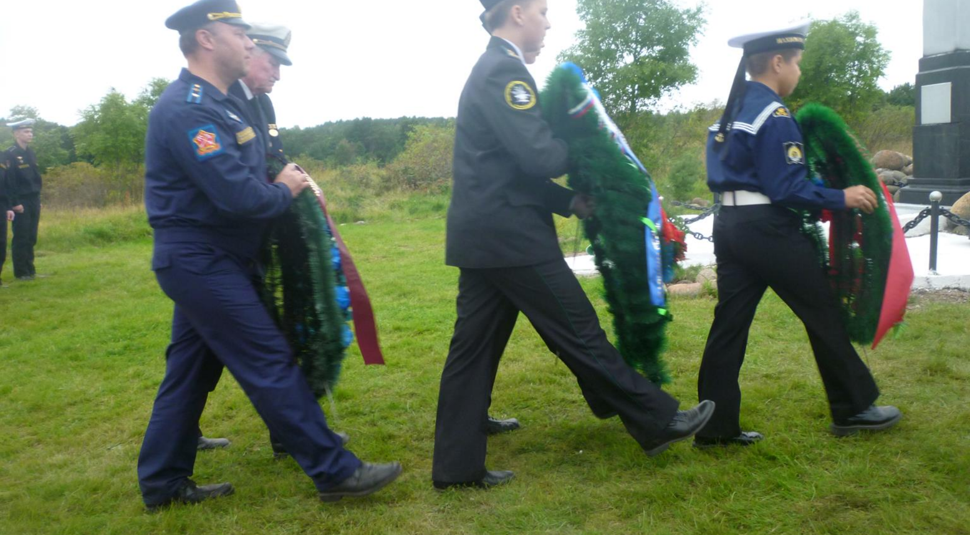
Памятная церемония, посвящённая 75-летию «Таллинского прорыва». 35 Остров Гогланд.