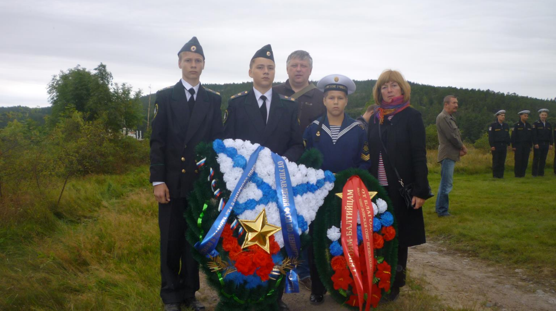
Памятная церемония, посвящённая 75-летию «Таллинского прорыва». Остров Гогланд.