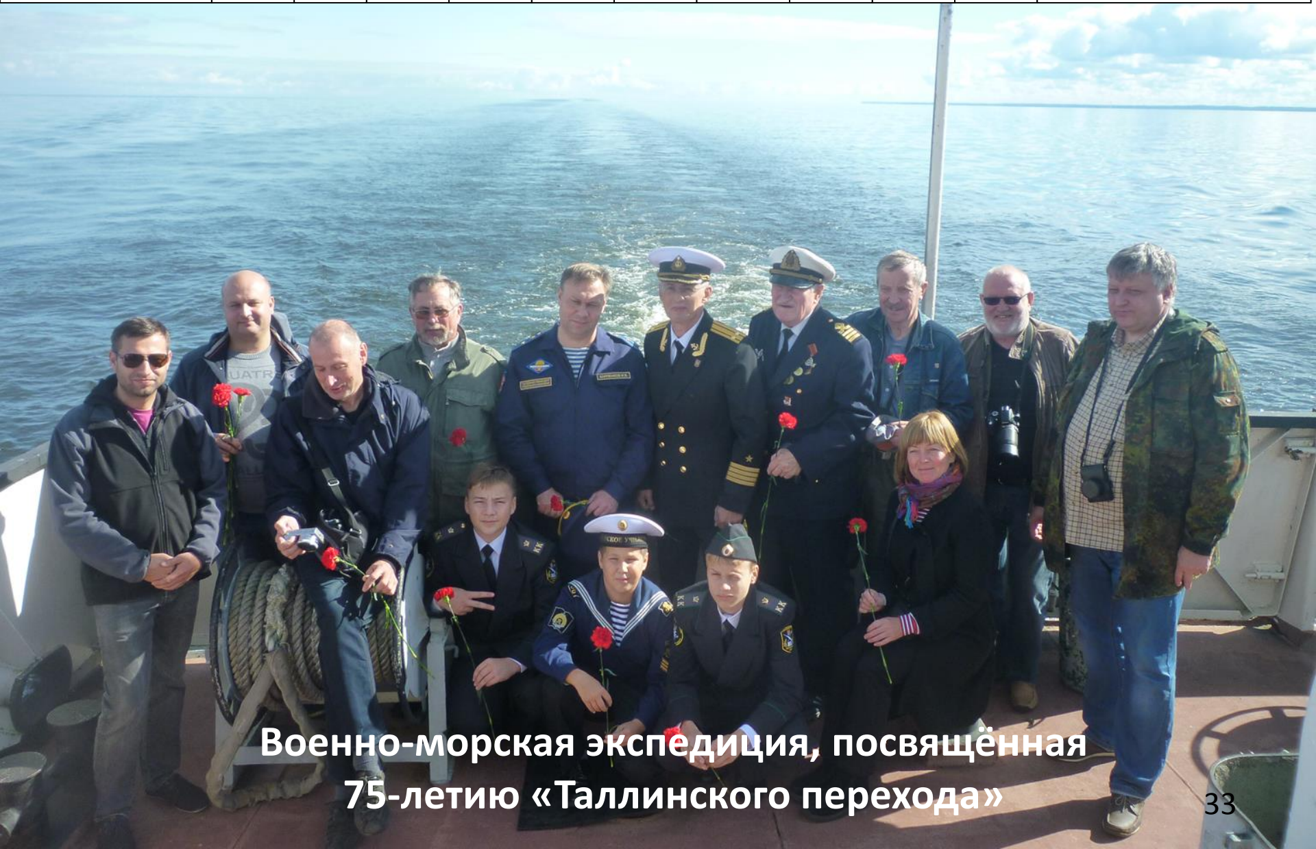
Военно-морская экспедиция, посвящённая 75-летию «Таллинского перехода»