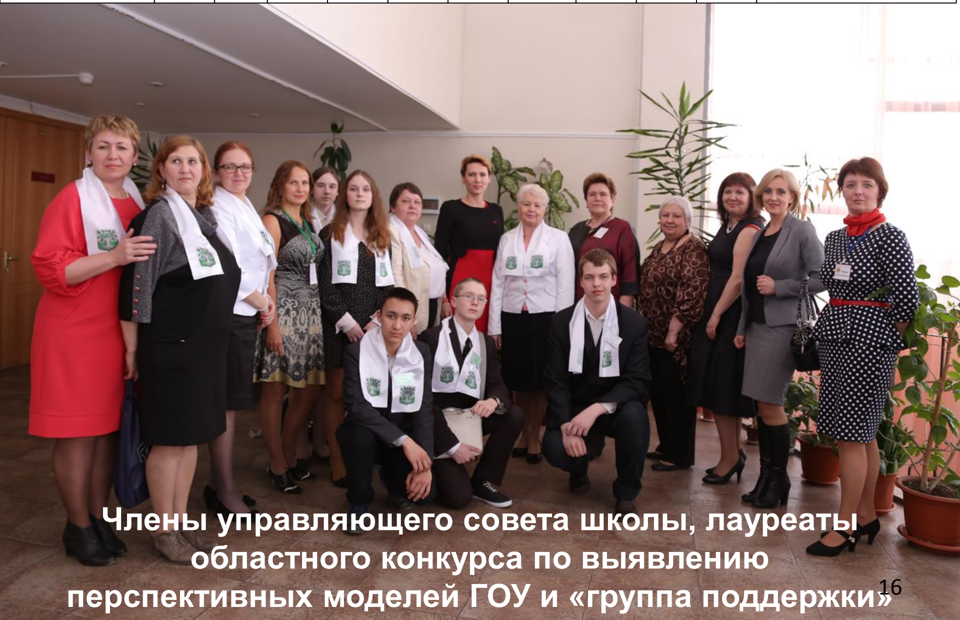
Члены управляющего совета школы, лауреаты областного конкурса по выявлению перспективных моделей ГОУ и «группа поддержки» 16