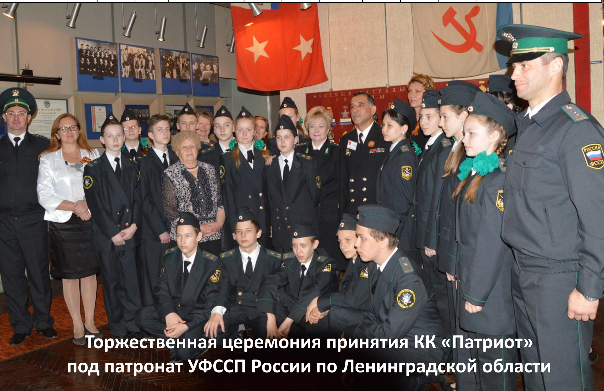
Торжественная церемония принятия КК «Патриот» под патронат УФССП России по Ленинградской области