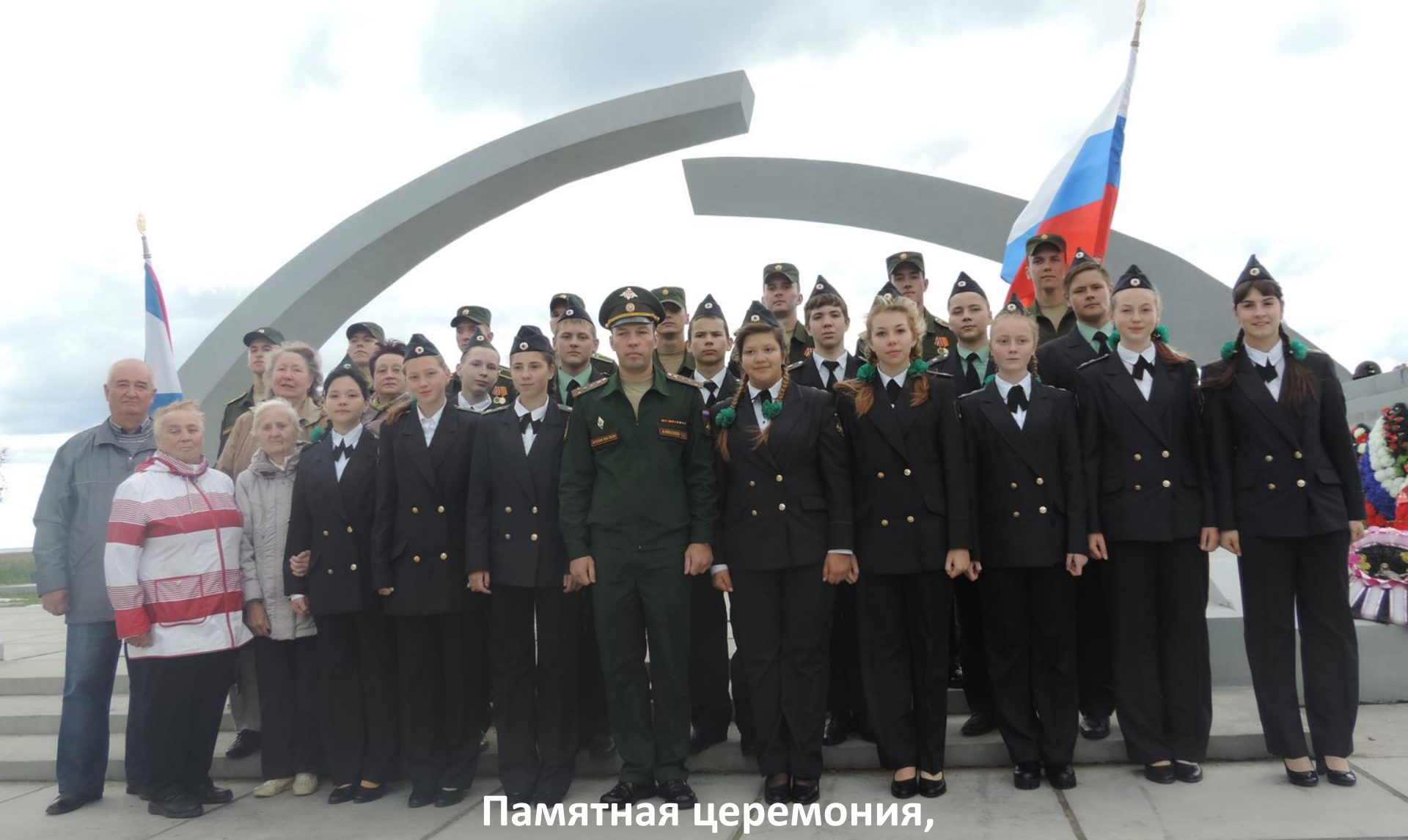
Памятная церемония, посвящённая 75-летию начала блокады Ленинграда